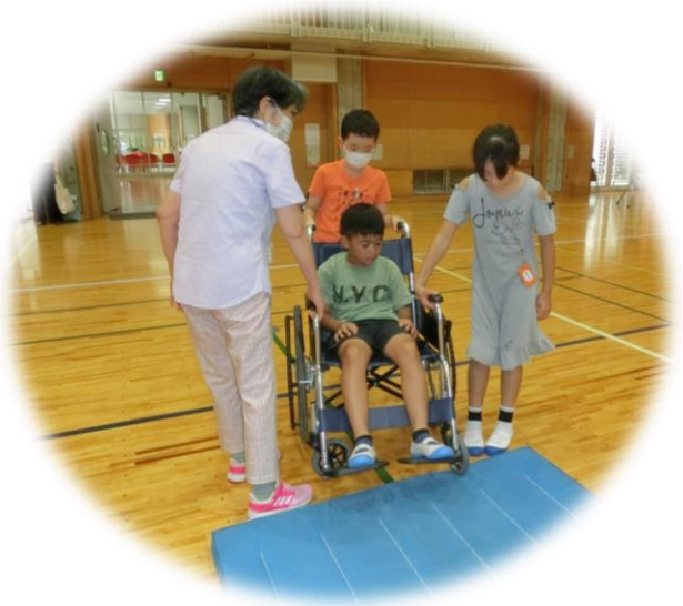
車いす体験／ハッピーマップ