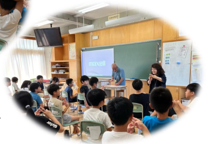
手話体験／ 日進・長久手・東郷聴覚障害者協会