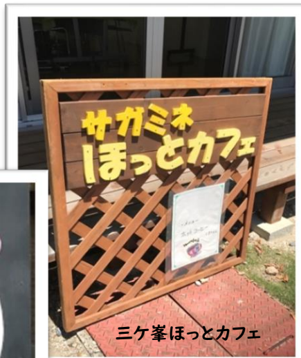
三ヶ峯ほっとカフェ