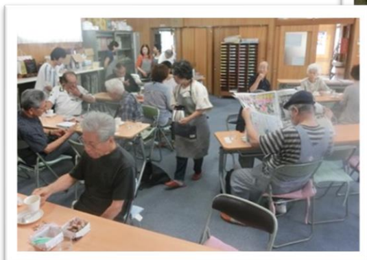
南ヶ丘コーヒーサロン

ぷらっとホームは、子どもから高齢者まで、いつでも誰でも気軽に立ち寄って趣味を楽しんだり、おしゃべりしたりできる地域の交流の場です。