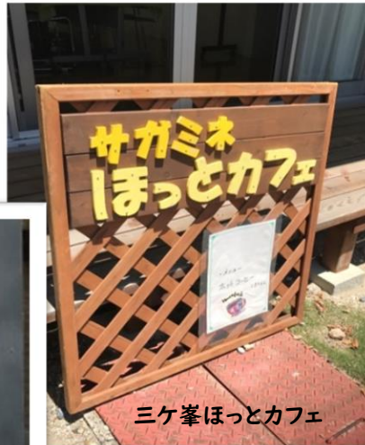
三ヶ峯ほっとカフェ