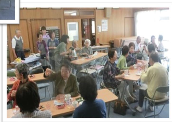
南ヶ丘コーヒーサロン