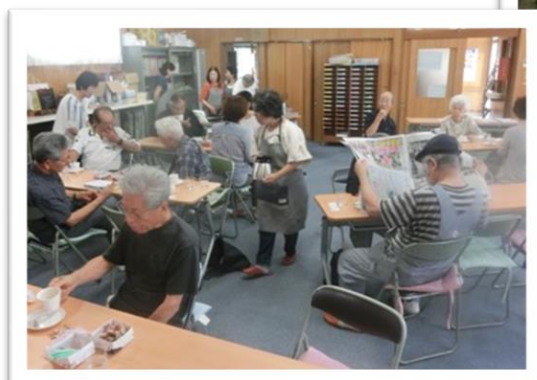
南ヶ丘コーヒーサロン

ぷらっとホームは、子どもから高齢者まで、いつでも誰でも気軽に立ち寄って趣味を楽しんだり、おしゃべりしたりできる地域の交流の場です。