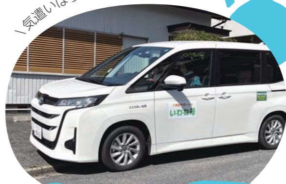
ちいきの見守りびと