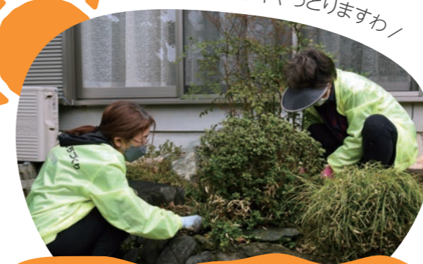
ワンコインの助け合い