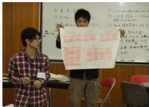
溝に前輪がはまってしまった。ひとりでは出れない。車いすでお買いものをしてみて感じたこと発表