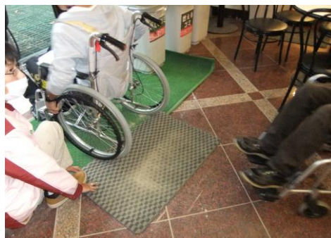
実際にお買いものをしてみる。高いところに置いてある商品はとれない。マットは引っかかって困る