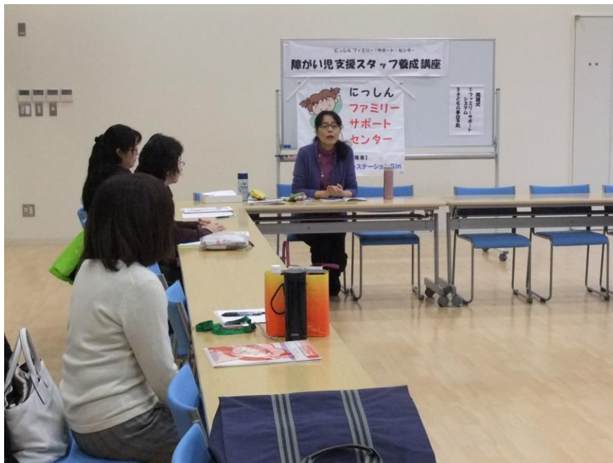
子育て支援について / ファミリーサポートセンター長