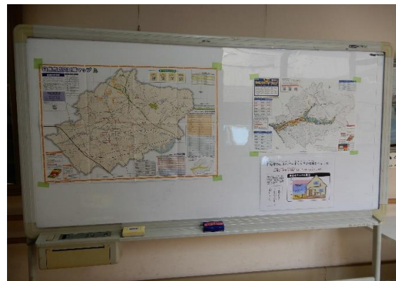
避難所紹介コーナー /日進市生活安全部防災交通課

★ イベントにご協力いただきましたボランティア団体の皆様ありがとうございました。