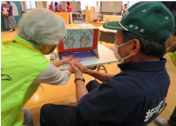
ブラックライトによる洗い残し手洗い指導 /日進災害ボランティアコーディネーターの会