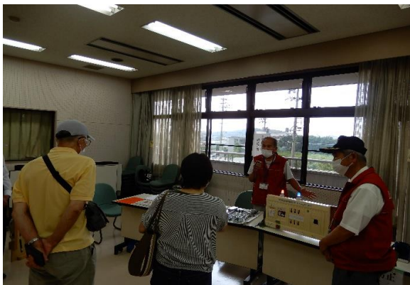
家具転倒防止対策の紹介 /日進防災推進連絡会