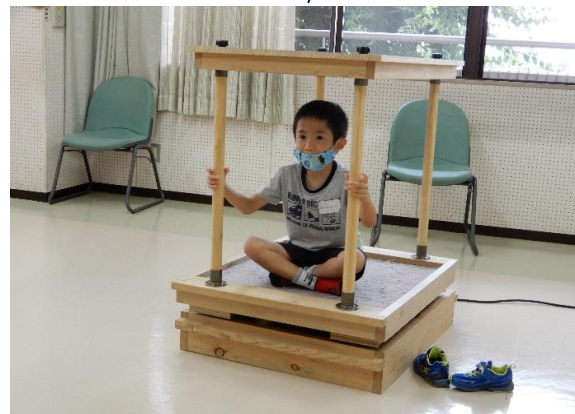
こなまず号（小型起震車）による揺れの体験 /日進災害ボランティアコーディネーターの会