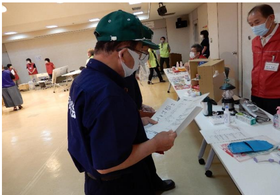
家庭非常持ち出しグッズ、防災食の展示 /日進防災推進連絡会