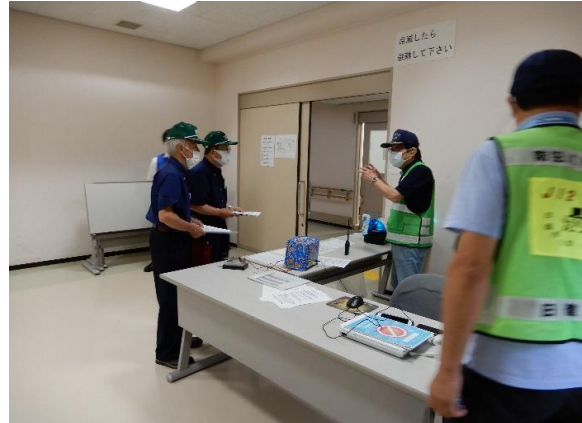
アマチュア無線の紹介 /日進市防災ハムクラブ