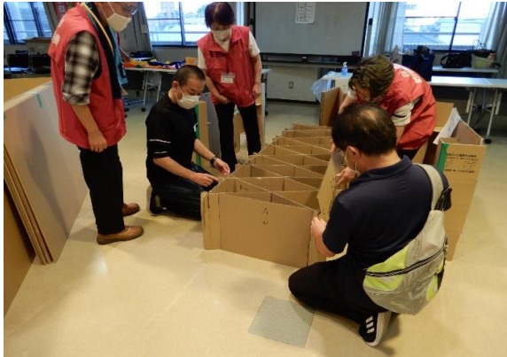
段ボールベッド紹介 /日進防災推進連絡会