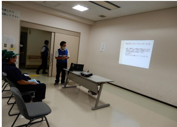
災害ボランティアセンターの紹介 /日進災害ボランティアコーディネーターの会