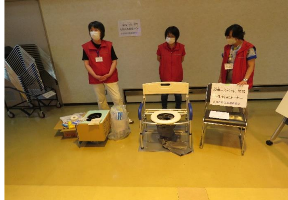
簡易トイレ紹介 /日進防災推進連絡会