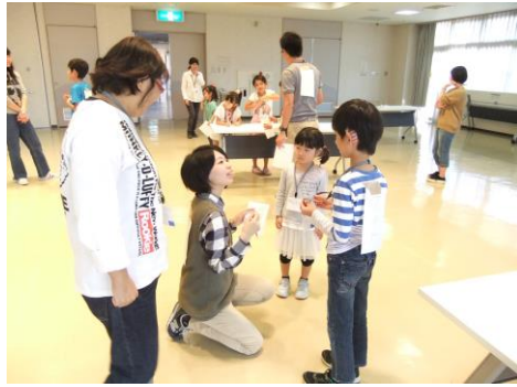
口の動きが読み取りやすいように 大きな口をあけてコミュニケーションを取る