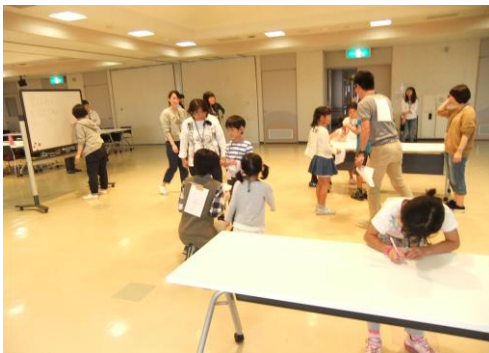
紙に書いて背中のお答えに関する質問をする