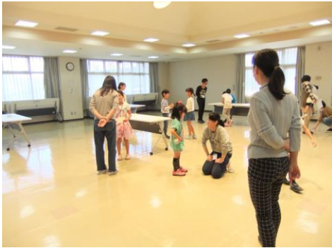
背中のお答えを導き出す質問をしている