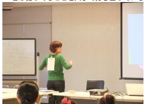
ゲーム説明 : 私は誰の答えは背中に貼る