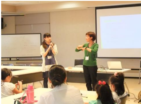
聴覚障害者学生団体の代表による手話