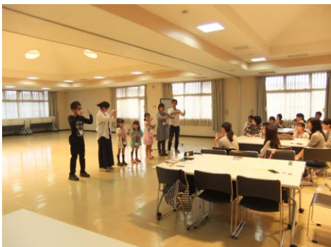
チームごとに手話ソングを披露する