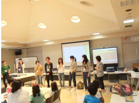
NGVの学生が指文字で自己紹介