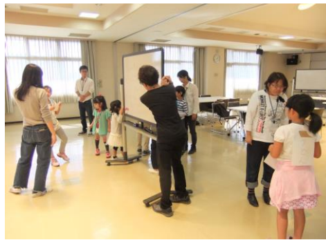
背中のお答えが分かったら学生に言う