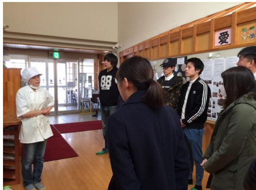
愛歩（生活介護施設）見学