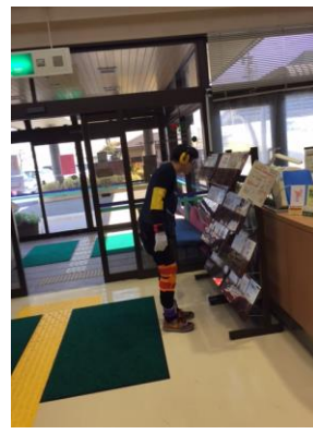
黄色の眼鏡をつけて指示されたチラシを探す