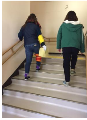
高齢者体験グッズをつけて階段昇降