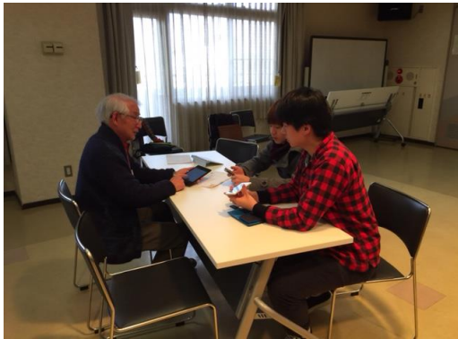
IT機器体験：IT機器を活用した障害者サポートを知る