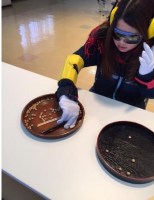
高齢者体験 : まめつかみ