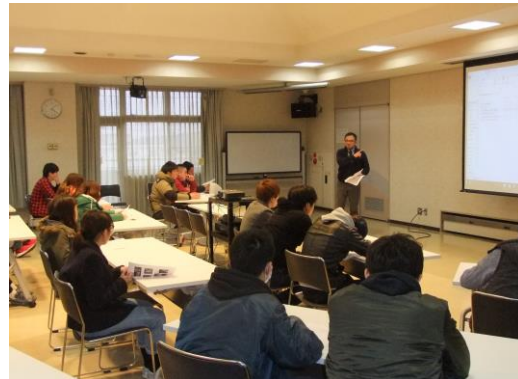
障害者が出演している番組をみて、学生の感想を聞く