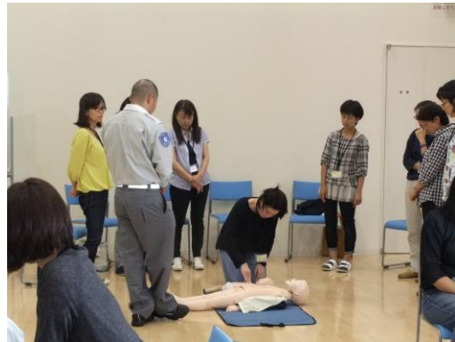
心肺蘇生法とAEDの使用方法について

心肺蘇生と人工呼吸とAED使用法を行ったが、 一番大事なことは心肺蘇生（胸骨圧迫30回）人工呼吸は感染症が気になる場合は行わない AED使用する時も胸骨圧迫を忘れないことが大事