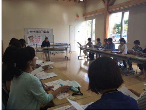
子どもの事故防止のための対応を学ぶ