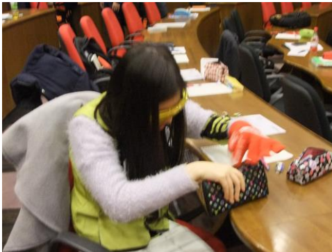
スーパーのレジでお財布からお金を出す時の体験。小銭がつかめない。目が悪くなり10円100円の区別がつかない。

65歳以上の高齢者人口は、3384万人で、総人口に占める割合は26.7%。前年(3295万人、25.9%)と比べると、89万人、0.8ポイント増と大きく増加しており、人口、割合共に過去最高となった。