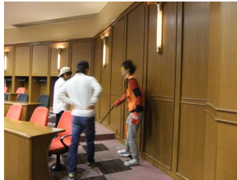
ベスト、肘、膝、靴におもりを入れて、色つきのゴーグルをし、杖を突きながら外で歩く体験をする。