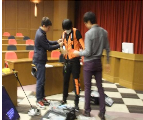
高齢者体験グッズを身につけて、高齢者がどのくらい動き辛いか体験してもらう

65歳以上の高齢者人口は、3384万人で、総人口に占める割合は26.7%。前年(3295万人、25.9%)と比べると、89万人、0.8ポイント増と大きく増加しており、人口、割合共に過去最高となった。