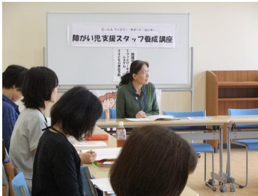
子育て支援について / ファミリーサポートセンター長