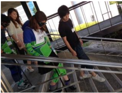
疑似体験グッズで階段昇降