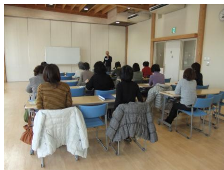
支援するにあたって 気楽に長い活動しましょう