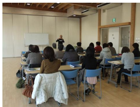
精神病院でのお話