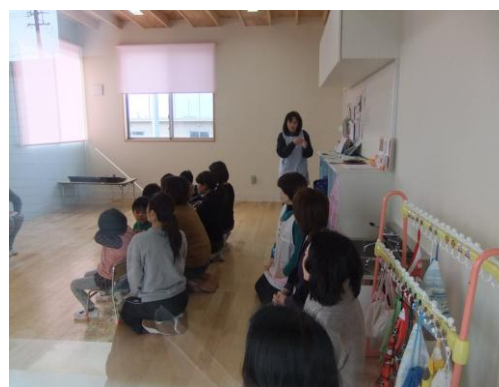
すくすく園 見学の様子