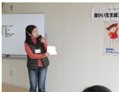
現在活躍されている障がい児支援スタッフによる実際の支援活動について